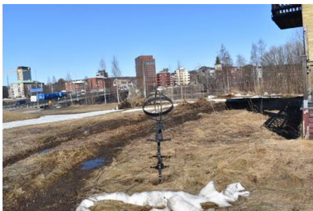
Soluret ska arkitekterna återbruka i det nya projektet.