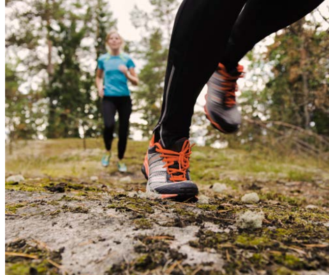
Nära till ett aktivt friluftsliv i det gröna.