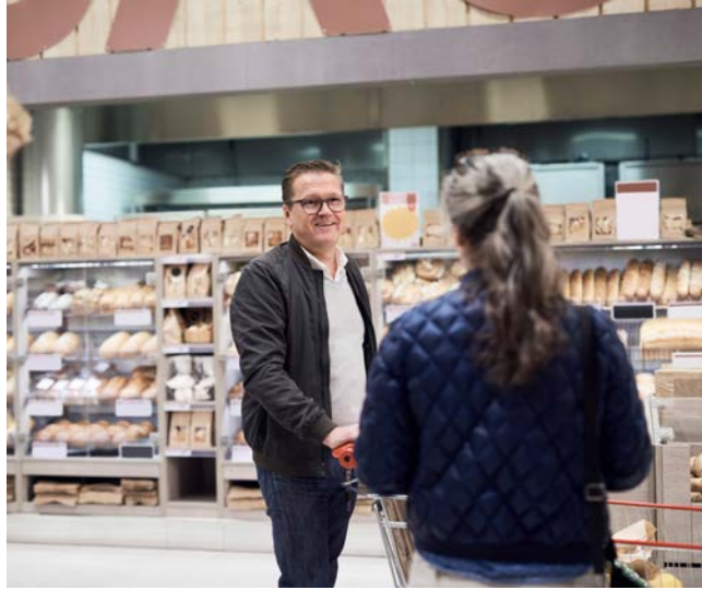
Matinköpen gör du smidigt hos din nya granne, Åkermyntan Centrum.