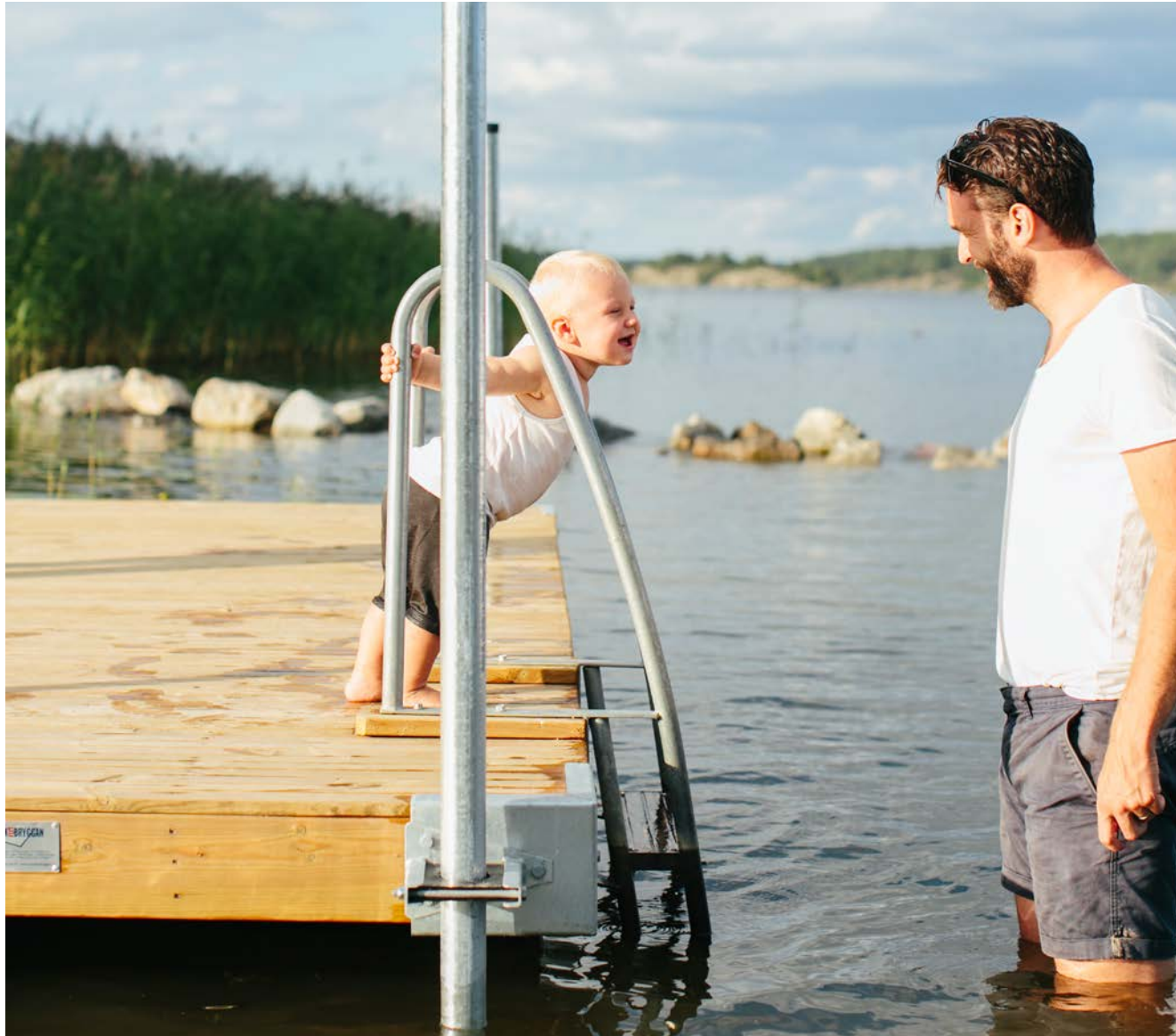
Badplatser och småbåtshamnar på cykelavstånd från ditt nya hem.