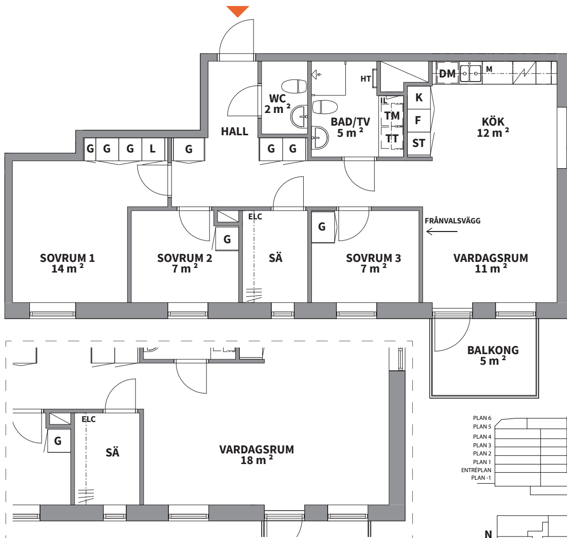
ALTERNATIV VID FRÄNVAL AV VÄGG