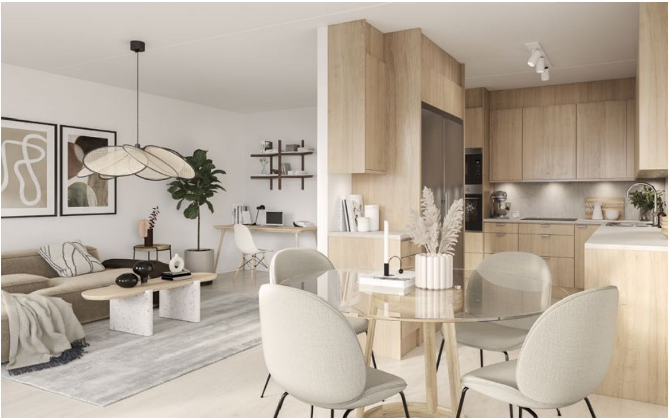
2 rok om 65 kvm med inredning TIDLÖS. Finns som tillval.