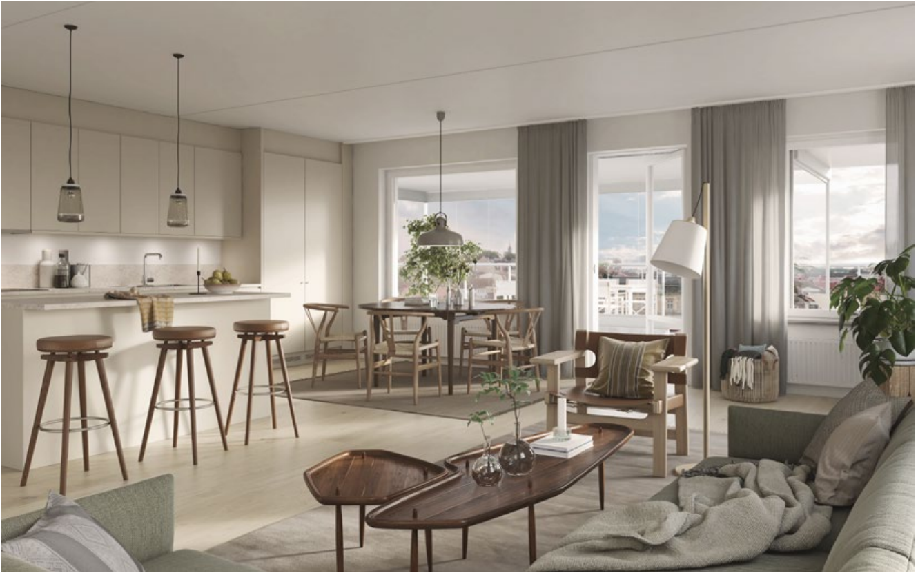
4 rok om 101 kvm med inredning SOLID. Finns som tillval.