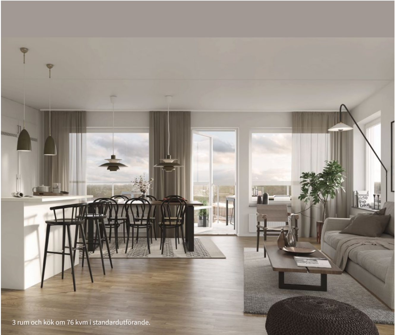
3 rum och kök om 76 kvm i standardutförande.